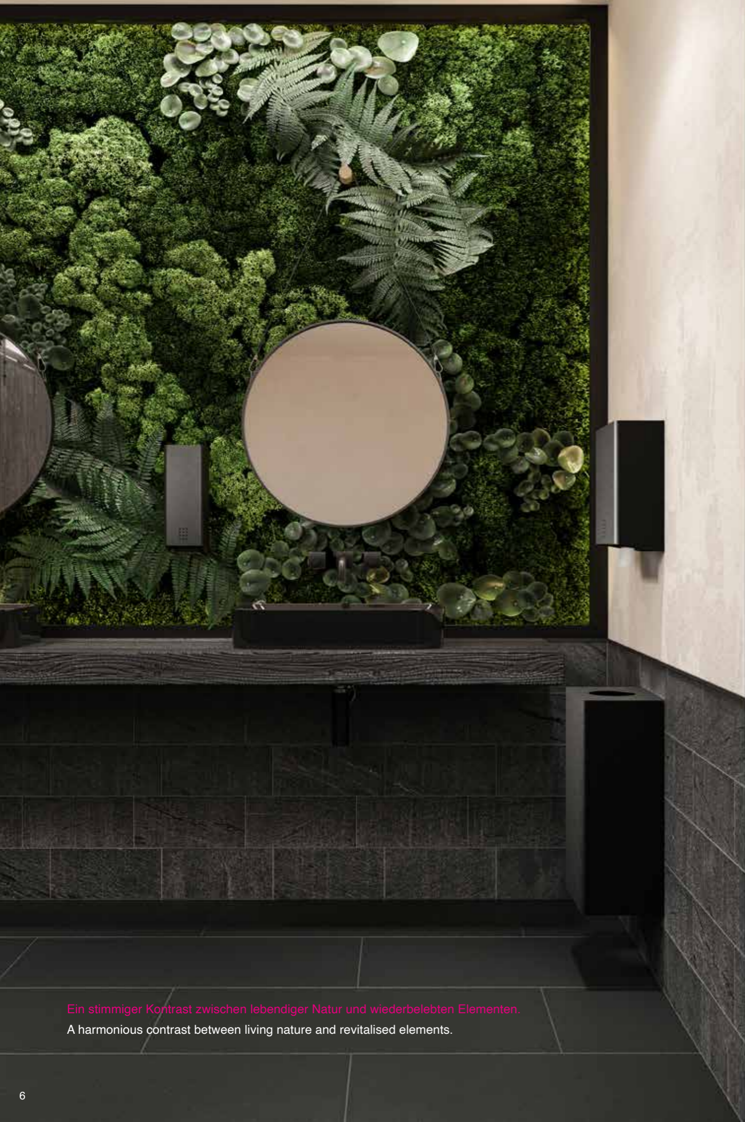
Ein stimmiger Kontrast zwischen lebendiger Natur und wiederbelebten Elementen. A harmonious contrast between living nature and revitalised elements.

Umgeben von den Elementen der Natur fühlen wir uns geerdet und kehren zum Ursprung zurück.